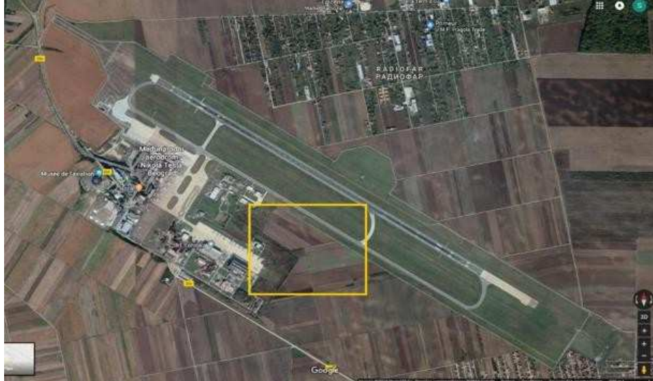
Slika 1: Pribavljanje zemlje planirano za 2027 (šire područje)

eksproprijaciju tokom 2027. godine pribavi oko 12 ha (do maksimalnih 34 ha - što ostaje da se utvrdi) južno od postojeće poletno-sletne staze, a po zahtevu BA. BA će u tu svrhu napraviti poseban Plan pribavljanja zemlje.