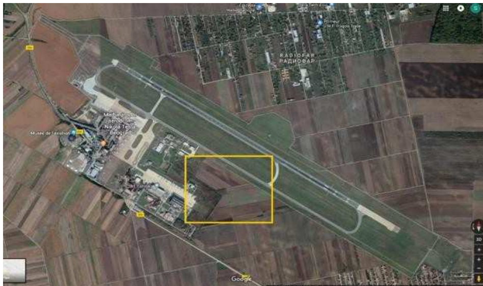
Слика 1: Прибављање земље планирано за 2027 (шире подручје)

Целокупни инвестициони програм реализован је и биће спроведен унутар постојећих граница аеродромског комплекса. Планирано је да Влада Републике Србије кроз експропријацију током 2027. године прибави око 12 ха (до максималних 34 ха - што остаје да се утврди) јужно од постојеће полетно-слетне стазе, а по захтеву БА. БА ће у ту сврху направити посебан План прибављања земље.